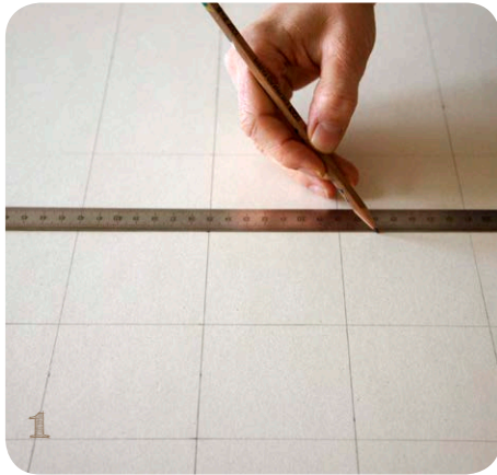
Abb. 1 Zeichne auf den großen Karton ein Raster aus 7 cm x 7 cm großen Quadraten.

Alternativ kannst Du Bierdeckel benutzen und die Materialien darauf kleben.