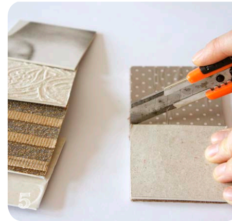
Abb. 5 Zerschneidet die Paare in der Mitte.

Abb. 2 Drehe den Karton um und bestreiche die Rückseite mit Alleskleber, um das Geschenkpapier festzukleben.