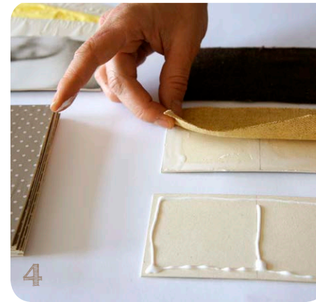
Abb. 4 Klebe die Stoff- und Papierstücke auf die Kartenpaare.

Alternativ kannst Du Bierdeckel benutzen und die Materialien darauf kleben.