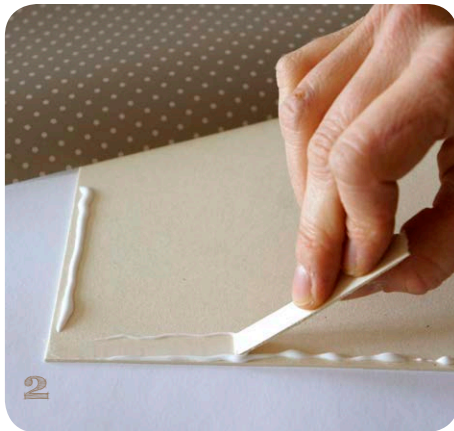
Abb. 2 Drehe den Karton um und bestreiche die Rückseite mit Alleskleber, um das Geschenkpapier festzukleben.

Zum Stoffe aufkleben eignet sich Holzleim besonders gut.